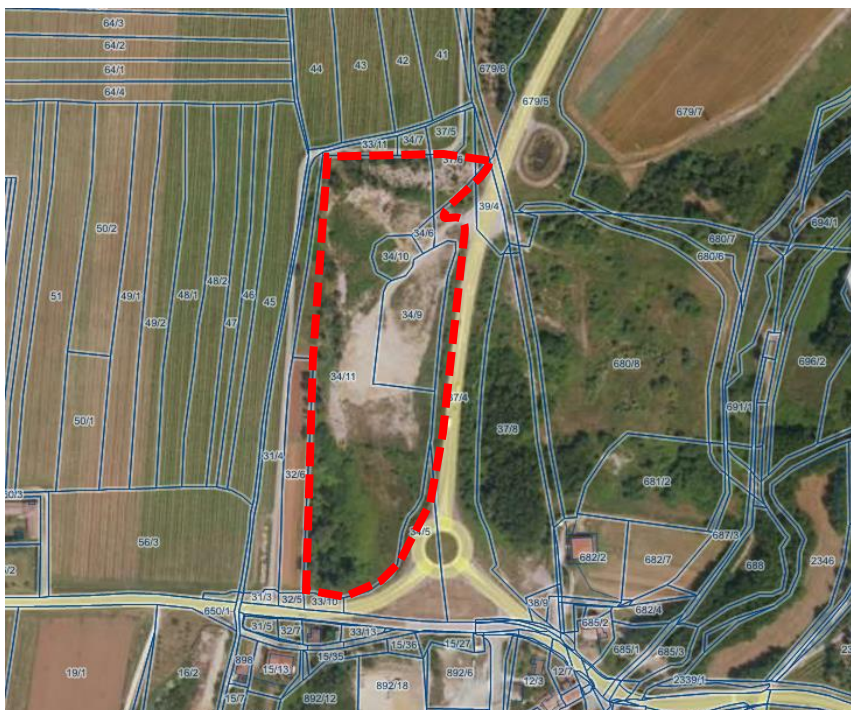
Slika: Prikaz območja predvidenega OPPN s prikazom parcel

Območje OPPN se v fazi izdelave dokumenta lahko spremeni zaradi načrtovanja spremljajočih potrebnih ureditev in posegov, navezav na sosednja območja, prilagoditev obstoječih ureditev, smernic nosilcev urejanja prostora ali drugih upravičenih razlogov.